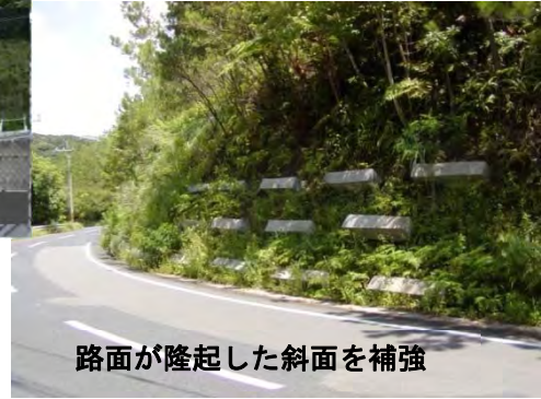
路面が隆起した斜面を補強