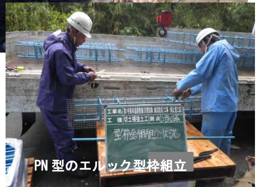
PN型のエルック型枠組立