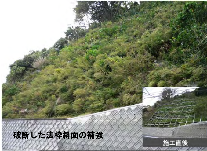
破断した法岸斜面の補強