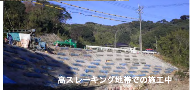
高スレーキング地帯での施工中