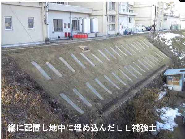
縦に配置し地中に埋め込んだLL補強土