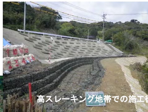
高スレーキング地帯での施工後