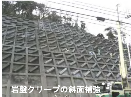
岩盤クリープの斜面補強